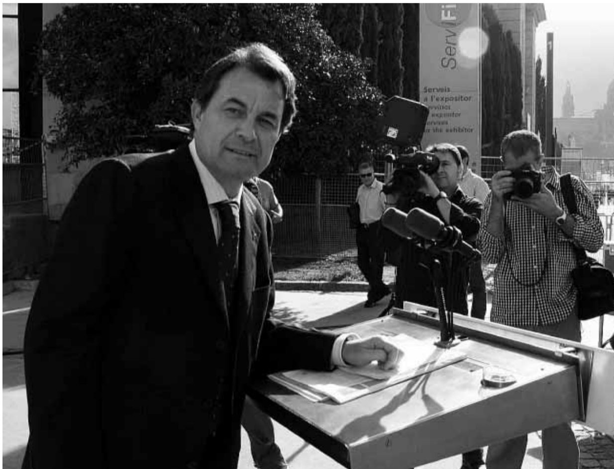
JOSÉ MARÍA ALGUERSUARI

La recta final de la campaña sigue según la estrategia prevista: propuestas claras, recuerdo de los "desastres" del tripartito y, pese a la firmeza en los discursos, el citado intento de seducción de aquellos ciudadanos que en el 2003 votaron con ilusión por un cambio, por un gobierno de izquierdas y se han quedado sin referencia. Para apelar a este sector, Mas utilizó un lenguaje práctico reconociendo que pese a que no todo son coincidencias ideológicas con estos ciudadanos les propone un esfuerzo común para mirar hacia el futuro y recuperar el prestigio y el pulso de Catalunya. Es la búsqueda de un centro sociológico am-