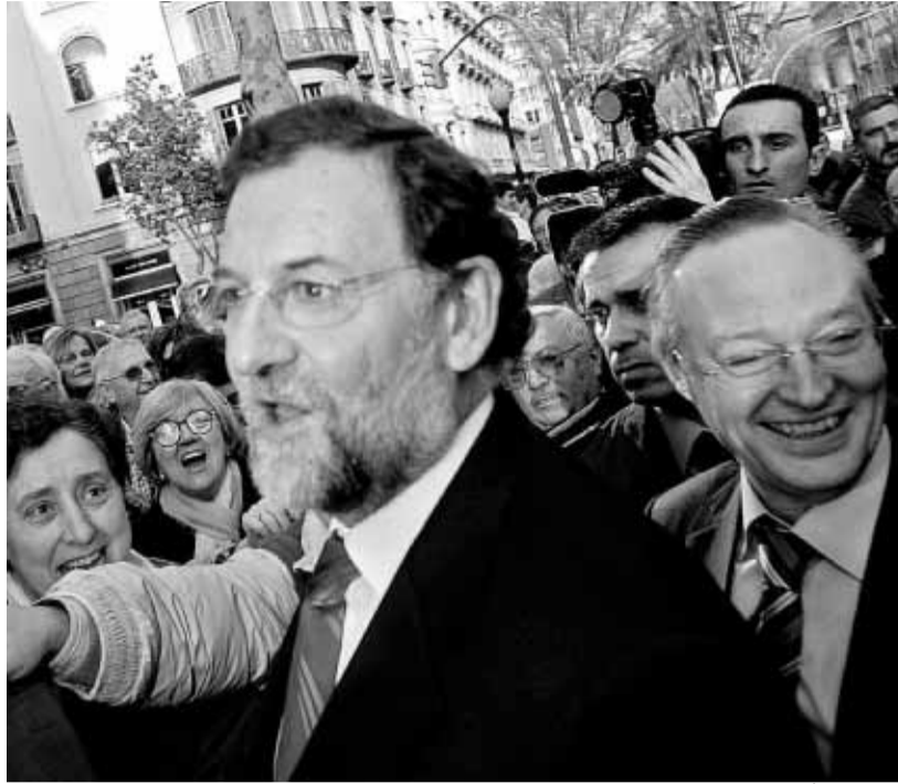
Mariano Rajoy, rodeado por simpatizantes en la Diagonal de Barcelona

Una decena de seguidores populares no tardó en acercarse a ellos con la intención de afeárselos su actitud, al considerarla “una provocación y una falta de respeto”. Curiosamente, la reacción más airada la protagonizaron algunos de los simpatizan-