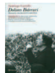
DOLORES IBÁRRURI. Pasionaria, una fuerza de la naturaleza Santiago Carrillo

El que fue ministro de Defensa de 1982 a 1991 revive con este libro la etapa de la transición dentro del ejército. Serra explica detalladamente la misión que tuvo que desarrollar durante su ministerio: transformar un ejército recién salido del 23-F en unas "fuerzas armadas democráticas".