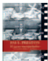
EL GRAN MANIPULADOR Paul Preston

Este libro narra la historia de varios españoles que, tras la Guerra Civil, decidieron combatir el nazismo espiando para los servicios secretos aliados durante la Segunda Guerra Mundial. La España de posguerra se redescubre como el escenario de una "guerra ignorada" durante años.