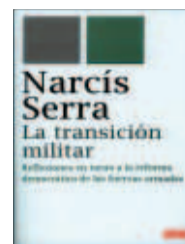
LA TRANSICIÓN MILITAR Narcís Serra

Selección de artículos sobre la distancia que une, o separa, a España y Catalunya. El último libro de Joan Barril recorre en ambas direcciones el siempre relativo espacio que existe entre esas dos "entidades" que "se necesitan de la misma forma que el Barça necesita al Madrid".