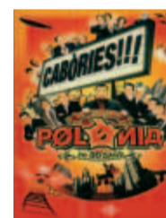
CABÒRIES!!! Varios autores