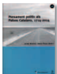
PENSAMENT POLÍTIC ALS PAÏSOS CATALANS Jaume Renyer i Enric Pujol

Documentadísima y extensa biografía sobre el general Antonio Escobar, fusilado en Montjuïc en 1940. Nacido en Ceuta, guardia civil y profundamente cristiano, Escobar luchó con los republicanos, aunque "de haber estado en el otro bando hubiera sido promovido a los altares".