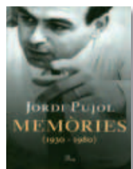
MEMÒRIES (1930-1980) Jordi Pujol